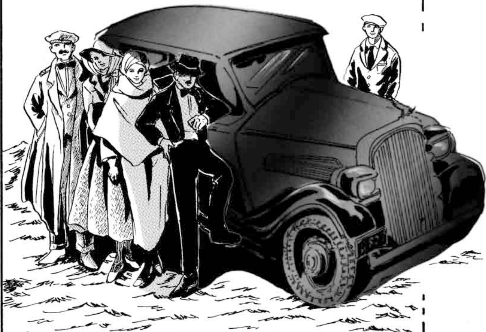
フォード自動車と客たち