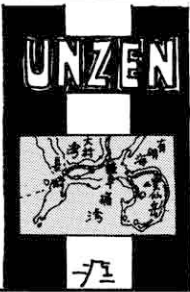
(当時のパンフレット)

当時の雲仙は 外国人の避暑地として 大人気でした リゾート地・雲仙で バカンスを過ごす 外国人にとって ゴルフは必須アイテム